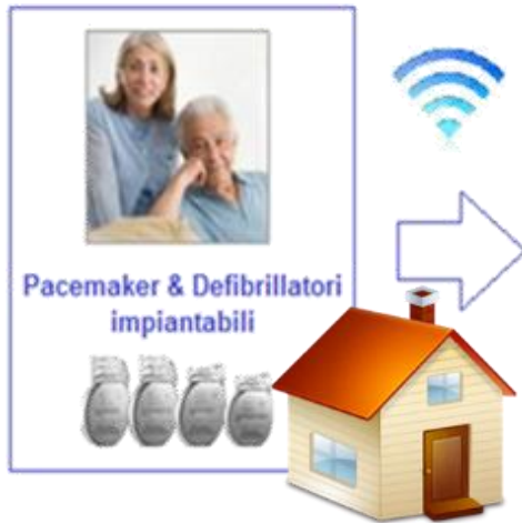
Pacemaker & Defibrillatori impiantabili

Condivisione DATI Clinici e Diagnostici Dispositivo, Informazioni per Gestione Paziente