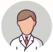
MEDICO MEDICINA GENERALE