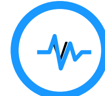
AMBULATORIO PM & ICD