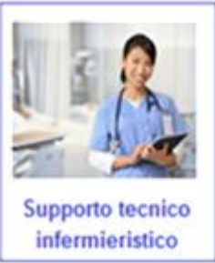
Supporto tecnico infermieristico