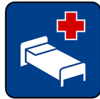
OSPEDALE DI COMUNITA'