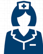
ASSISTENZA DOMICILIARE INTEGRATA